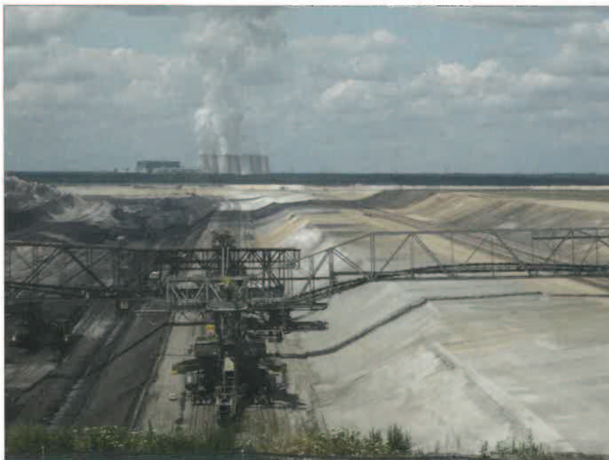
Schlecht für Wasser, Luft und Gesundheit: Braunkohletagebaue und -kraftwerke

Das Wasserwerk Friedrichshagen am Müggelsee, das ein Viertel der BerlinerInnen mit Trinkwasser versorgt, entnimmt seinen Rohstoff größtenteils aus dem Uferfiltrat der Spree. Dort wird der offizielle Grenzwert von 250mg/l für Sulfat im Trinkwasser immer öfter überschritten. Aktuelle Messdaten belegen, dass die Werte im Müggelsee im Sommer 2015 dauerhaft über 250 mg/l lagen und teilweise sogar 300 Milligramm überschritten – Tendenz steigend. Schuld an den erhöhten Sulfatwerten sind die Braunkohletagebaue in der Lausitz: Durch den Kohleabbau verbinden sich