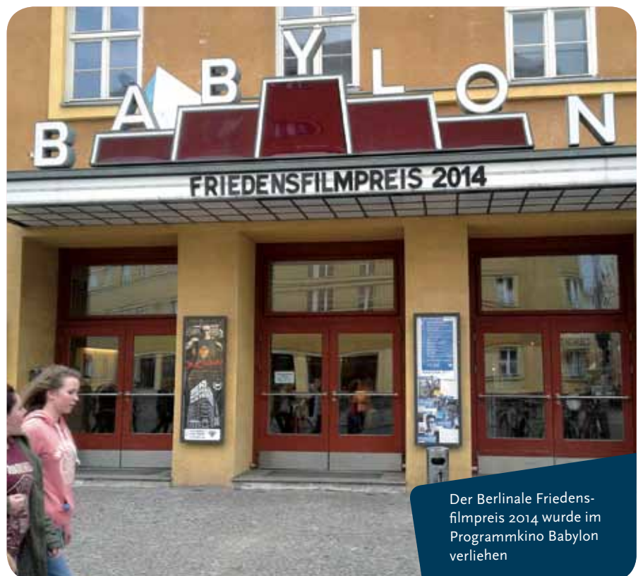
Der Berlinale Friedensfilmpreis 2014 wurde im Programmkinobabylon verliehen

Der Filmmacher Hubert Sauper fliegt mit einem Kleinflugzeug nach Afrika, ins Epizentrum eines Konfliktes: in den Sudan. Bei jeder seiner vielen Landungen begegnet er Menschen, die Akteure in einer für den Kontinent exemplarischen Situation sind. Was zunächst interveni-